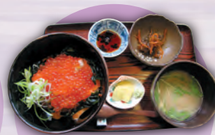
いくらサーモン丼 ¥4,000