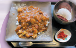
噴火湾ほたてカレー ¥1,650